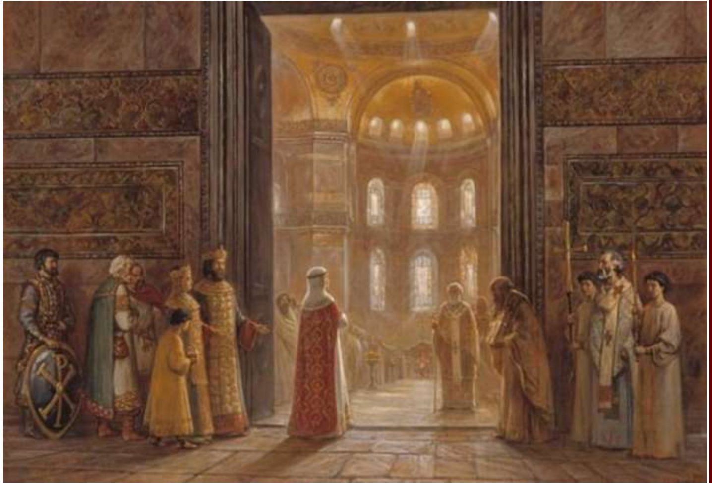
Η Αγία Όλγα μπαίνει στην Αγία Σοφία. Πίνακας του Igor Mishkov.

Το 1453, η Κωνσταντινούπολη κατακτήθηκε από τους Οθωμανούς, οι οποίοι μετέτρεψαν την Αγία Σοφία σε τζαμί. Στα χρόνια που ακολούθησαν, μωσαϊκά σοβατίστηκαν, τα μάρμαρα καλύφθηκαν με χαλιά και πολλά από τα παράθυρα που είχαν σχεδιαστεί για να φέρουν ακτίνες φωτός καλύφθηκαν. Ανεγέρθηκαν οι μιναρέδες. Το κτήριο, ωστόσο, παραμένει ευθυγραμμισμένο με την ανατολή, όπως είθισται για τις χριστιανικές εκκλησίες, και λόγω της σημασίας του ως ο καθεδρικός ναός της αυτοκρατορικής πρωτεύουσας, συγκεκριμένα με την ανατολή του χειμερινού ηλιοστασίου. Κατά την μετατροπή της Μεγάλης Εκκλησίας σε τέμενος, οι Οθωμανοί επειδή δεν μπορούσαν να στρέψουν το κτήριο προς τη Μέκκα, όπως είναι συνηθισμένο για τα τεμένη, έπρεπε να τοποθετήσουν το μιχράμπ, δηλαδή την εσοχή που συνήθως βρίσκεται στη μέση του τείχους της κίμπλα και δείχνει την κατεύθυνση της μουσουλμανικής προσευχής, λίγο προς τα δεξιά στο Ιερό, μια λεπτομέρεια που διαταράσσει τη συμμετρία του κτηρίου.