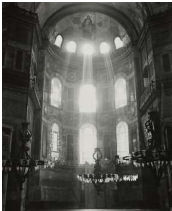
Η Αγία Σοφία το 1935.

Μπορεί η ιατρική επιστήμη να μην ήταν τόσο ανεπτυγμένη εκείνη την εποχή, τα μαθηματικά όμως ήταν. Ο Ιουστινιανός ανέθεσε το αρχιτεκτονικό σχέδιο σε δύο λαμπρούς μαθηματικούς τον Ισίδωρο τον Μιλήσιο και τον Ανθέμιο τον Τραλλιανό. Ο Ισίδωρος δεν ήταν γνωστός ως αρχιτέκτονας, αλλά ως ένας ευυπόληπτος καθηγητής πανεπιστημίου ο οποίος ήταν θαυμαστής του Αρχιμήδη και του Ευκλείδη, και συνέλεγε συστηματικά το έργο τους. Το επιστημονικό έργο του Ανθέμιου πραγματεύεται μεταξύ άλλων, το πώς περνάει το φως μέσα από οπές, κάτι που αποδείχθηκε βασικό στοιχείο για την Αγία Σοφία, της οποίας ο διαμήκης άξονας σχεδιάστηκε έτσι ώστε να συμπίπτει με την ανατολή του χειμερινού ηλιοστασίου - ένα σύμβολο φωτός στην καρδιά του σκότους.