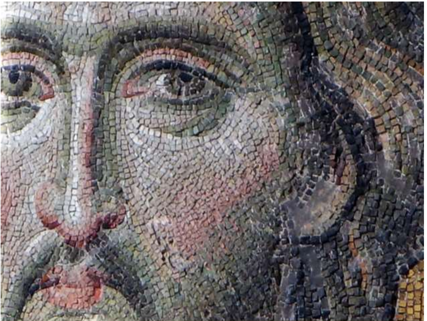
ΤΟ ΜΟΣΑΙΚΟ ΤΗΣ ΔΕΗΣΗΣ ΣΤΗΝ ΑΓΙΑ ΣΟΦΙΑ, ΛΕΠΤΟΜΕΡΕΙΑ ΤΟΥ ΠΡΟΣΩΠΟΥ ΤΟΥ ΙΗΣΟΥ

Η ασυνήθιστα κρύα άνοιξη του 542 βρήκε την Κωνσταντινούπολη, την τότε πρωτεύουσα της Ανατολικής Ρωμαϊκής Αυτοκρατορίας, να πολεμάει την πρώτη πανδημία στην ιστορία της. Τα νεκρά πτώματα συσσωρεύονταν στους πλακόστρωτους δρόμους. Ήταν η πρώτη μεγάλη κλίμακας εμφάνιση της πανούκλας, που προκλήθηκε από το βακτήριο Yersinia Pestis , το οποίο τελικά θα έπαιρνε εκατομμύρια ζωές. Η πανδημία τρύπωσε ακόμη και στο Μεγάλο Παλάτι. Καθώς ο αυτοκράτορας Ιουστινιανός καιγόταν από πυρετό, οι γιατροί του παλατιού δεν ήξεραν τι να κάνουν. Η μόνη άμυνα που είχαν οι άνθρωποι τότε ήταν αλοιφές, καραντίνα και το να ζητήσουν βοήθεια από τους ουρανούς.