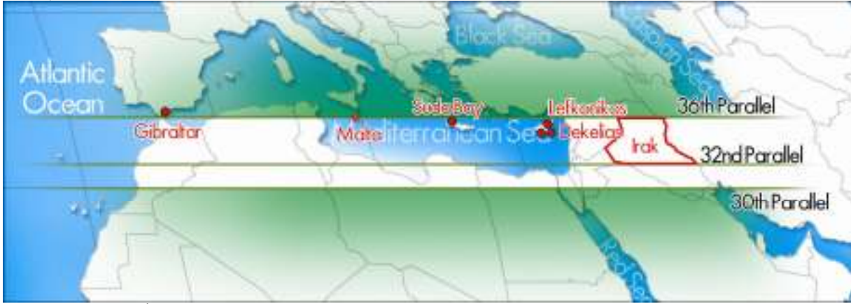
Kaynak - planlama: İ. Mazis

Anglosakson jeostratejik ilgi alanı içine giren, 30. ile 36. paralel arasındaki bu yatay alanın önemi doğu ucunda artıyor. Bunun sebebi, önemli hidrokarbon boru hatlarının bitim noktalarının orda bulunması veya yeni bitim noktalarının plânlamasıdır. Sözü ettiğimiz boru hatları şunlardır: 1- Bakü – Tiflis – Erzurum. Rus topraklarından geçmediğinden Anglosakson Özel İlişkisi (Relation Special) için büyük politik önem taşıyan boru hattı. 2- Suriye üzerinden Kerkük – Musul – Hayfa boru hattı. 3- Bitiş noktası Türkiye topraklarında İskenderun körfezinde (Yumurtalık) olan Kerkük – Musul boru hattı.